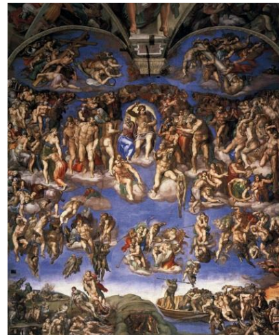
Страшни суд (Сикстинска капела, Ватикан, Италија, 1537 – 1541.)

Микеланђело је на слици приказао догађај који ће уследити након што се Христ појави да би судио човечанству.