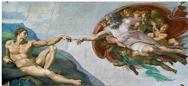
Стварање Адама (Сикстинска капела, Ватикан, Италија, 1508 – 1512.)

Микеланђело је насликао тренутак када Бог удахњује душу Адаму.